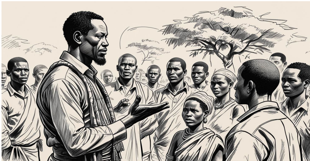
Conception : Djiril et Koffi, 2025 ; Réalisation : générée de l'IA

Tieme dugutigi be dugudenw la kunnafonila sigida lakandali la