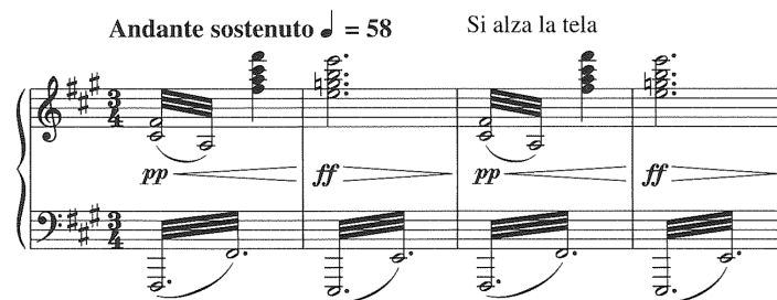
Exemple 5 : Puccini 2015: 240.

Plus qu'une valeur symbolique idéale, ce motif tient lieu de référence temporelle. 61 En le faisant revenir sous plusieurs formes, le développement musical de l'acte renvoie à l'écoulement du temps. 62 L'efficacité dramatique du final de Manon dépend précisément d'une prise de conscience permanente du temps qui passe et qui condamne les protagonistes. Manon rappelle ainsi à Des Grieux que le temps s'envole inéluctablement et qu'il n'est pas « l'heure de pleurer » : « Il tempo vola...baciarmi! ». Puccini le figure par l'apparition des nombreux dérivés du motif du nom, notamment dans l'ouverture et le final de l'acte, lorsque le présage lugubre de la mort de Manon ralentit le temps à l'extrême. Il s'agit de l'occurrence la plus étirée de la cellule initiale du motif construit sur son rythme iambique (exemple 5) ; ici, noire-blanche pointée (♩ = 58), soit trois fois plus lent que son occurrence principale (exemple 4) ou cinq fois plus lent que sa première apparition.