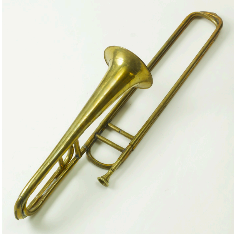
Abb. 2: Bassposaune in Es mit Doppelzug, Anonym, um 1825, Klingendes Museum Bern, Inv. Nr. 1226.

Folgende Instrumente der überlieferten Rorschacher Besetzung sind demzufolge nicht erhalten: Terzflöte, Klarinetten (laut Besetzungsliste im Posaunenbuch waren es neun), zwei Naturtrompeten, Serpent und zwei kleine Trommeln.