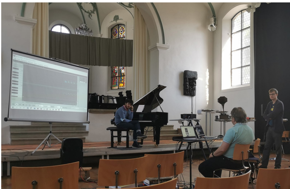
Abb. 3. Szene während eines „Magic-Piano“-Meisterkurses im Künstlerhaus Boswil, bei dem Studierende am Yamaha Disklavier mit den digitalisierten Rollenaufnahmen interagieren konnten.