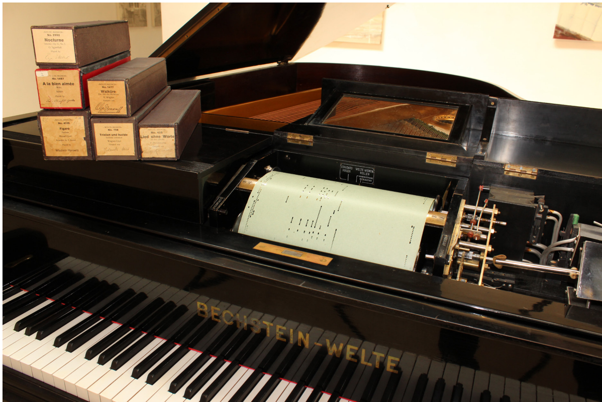
Abb. 1. Ein vorbildlich restauriertes Welte-Mignon-Instrument im Besitz von Markus Fuchs (Oetwil a. S.), das bei Veranstaltungen des Projekts zum Einsatz kommt.