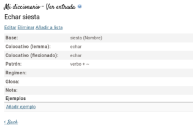
Fig 13. Un ejemplo de diccionario personalizado

HARenEs ofrece también la posibilidad de administrar recursos personales para que el usuario pueda almacenar las colocaciones que aprende, los errores frecuentes que comete junto con sus correcciones, ejemplos, etc. Vid. la siguiente figura con un ejemplo de un diccionario personalizado.