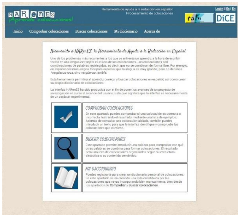
Fig. 11. Pantalla inicial de HARENES

El entorno consta de tres componentes principales: 1) el verificador de colocaciones, que propone sugerencias en caso de que la colocación consultada sea incorrecta; 2) la búsqueda de colocativos de una base dada, por medio principalmente de medidas estadísticas en el corpus; 3) el diccionario de colocaciones personalizado, en donde el usuario puede guardar las colocaciones que le interesen con sus ejemplos, así como el registro de los errores y sus soluciones. En la funcionalidad “comprobar”, el usuario verifica la corrección de una colocación específica y, en el caso de una combinación incorrecta, la herramienta propone sugerencias junto con ejemplos. Véase la figura siguiente en donde el usuario ha pedido comprobar tomar un paseo .