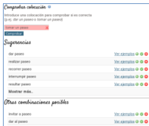
Fig. 12. Sugerencias de corrección proporcionadas por HARENES

El entorno consta de tres componentes principales: 1) el verificador de colocaciones, que propone sugerencias en caso de que la colocación consultada sea incorrecta; 2) la búsqueda de colocativos de una base dada, por medio principalmente de medidas estadísticas en el corpus; 3) el diccionario de colocaciones personalizado, en donde el usuario puede guardar las colocaciones que le interesen con sus ejemplos, así como el registro de los errores y sus soluciones. En la funcionalidad “comprobar”, el usuario verifica la corrección de una colocación específica y, en el caso de una combinación incorrecta, la herramienta propone sugerencias junto con ejemplos. Véase la figura siguiente en donde el usuario ha pedido comprobar tomar un paseo .