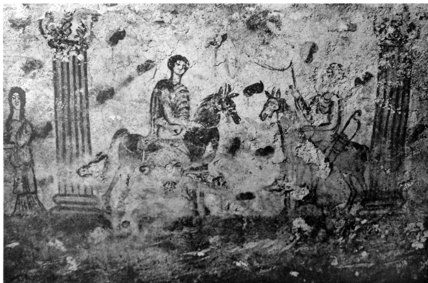
Рис. 4. Роспись сегмента IV. 2 расписного склепа 1900 г. (по книге: М. Ростовцев. Античная декоративная живопись на юге России . Атлас [СПб. 1913] табл. ХСIII)