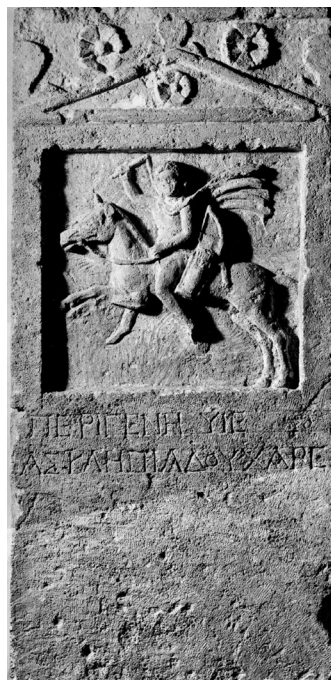
Рис. 2. Пантикапейская стела КБН № 491

Таким образом, можно предложить, например, следующий вариант восстановления: