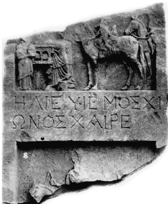
Рис. 3. Пантикапейская стела КБН № 414