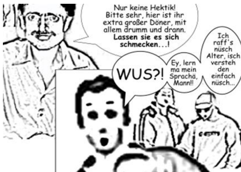
Abbildung 2: Ausschnitt aus einem Comic; gezeigt wird die Interaktion zwischen dem türkischen Döner-Verkäufer, der lupenreines Hochdeutsch spricht, und einer Gruppe deutscher Großstadtjugendlicher, die ihre eigene Sprache an das Stereotyp der türkischen "Kanaksprak" angepasst haben. Vgl. die Koronalisierung in nüscht, isch ( http://1.bp.blogspot.com/_0msJlvGVVi8/TOrinLivRI/AAAAAAAAADY/vsEYPaJnNfM/s1600/comic_doener.jpg ).

Soziolinguistisch saliente Merkmale sind also solche, die eine sozial-affektive Bewertung erfahren. Wichtig ist, dass das Merkmal allein bedeutungsvoll ist. Oft ist es für die Mitglieder einer Sprechgemeinschaft gar nicht relevant, einzelne Merkmale zu isolieren und mit sozialer Bedeutung zu verbinden. Vielmehr erkennen sie einen Stil (cf. Eckert 2004), der aus einer großen Zahl kookkurrierender Merkmale besteht und holistisch interpretiert wird. Soziolinguistisch saliente Einzelmerkmale sind also eher die Ausnahme als die Regel. Wenn aber eine soziale Bewertung des Merkmals vorliegt, so die These dieses Beitrags, ist das Merkmal auffälliger als eines, das lediglich kognitiv oder gar nur physiologisch als Figur vor einem Grund profiliert ist.