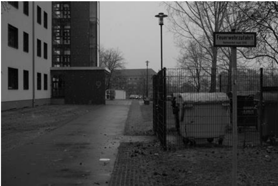
Abb. 2: Geltungsbereich des Schildes: "Feuerwehrezufahrt/Halteverbot nach StVO/[Wappen mit Schriftzug: "FEUERWEHR CHEMNITZ 574"]" (Chemnitz Dez. 2011), cf. Abb. A1 im Anhang

Wie in Abb. 2 und vor allem in A1 ersichtlich wird, ist die semiologische Gestalt, in der dieses gesicherte Wissen zum Ausdruck kommt, von komprimierter Natur. Drei Nominalphrasen, die im Wesentlichen aus Symbolfeldausdrücken bestehen, und eine relationierende Präposition bilden den Kern der verbalisierten Wissens Elemente. In der intermedialen Transkription mit der sichtbaren Texturkonfiguration des öffentlichen Raums, die einen befahrbaren Weg erkennbar