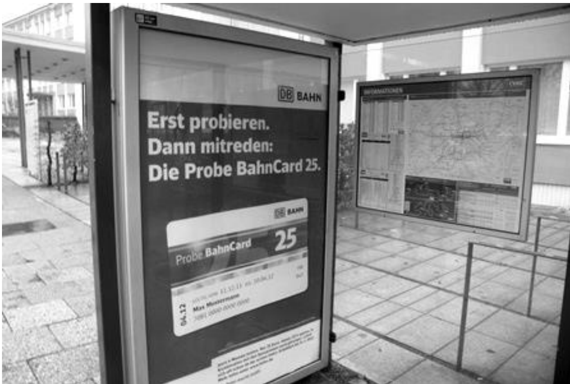
Abb. 3: Werbeplakat und Aushang des Abfahrts- und Netzplanes an einer Bushaltestelle (Chemnitz, Dez. 2011).