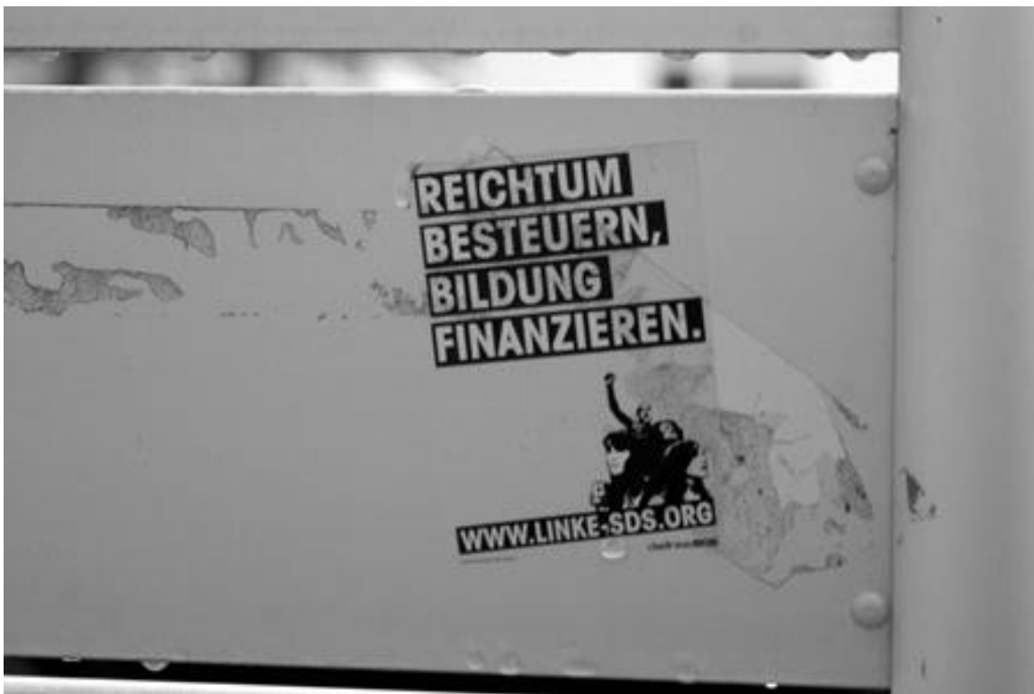
Abb. 4: illegales Kleinplakat mit politischem Statement (gelber Grund) "REICHTUM BESTEUERN, BILDUNG FINANZIEREN./[BILD]/WWW.LINKE-SDS.ORG/BITTE NICHT WILD PLAKATIEREN. VISDP: DIE LINKE.SDS/die linke.SDS" an der Rückseite eines Schildes ein Fakultätsgebäude betreffend (Chemnitz, Dez. 2011), cf. Abb. A2. 54

(3) strittiges Wissen : An einem anderen Ort des diskursiven Gefüges platzieren sich Gattungen, die ideologische und politische Statements mithilfe von Kommunikationsformen im öffentlichen Raum kommunizieren, um somit an der argumentativen Durchsetzung von thematisch gebundenem Wissen streitend teilzuhaben. Diese Kommunikationsformen teilen die Zeitgebundenheit mit der Familie (2) und bieten damit die Möglichkeit, an aktuelle Diskurse anzuschließen. Sie unterscheiden sich aber von dieser Familie, wie die obige Figur zeigt, in den produktiven medialen Prozeduren und damit wesentlich in den raumbezogenen adressierenden Prozeduren. Die transgressive Platzierung ermöglicht die Etablierung einer Diskursnische, die im öffentlichen Raum eine Möglichkeit aufspannt, Gegendiskurse losgelöst von den führenden Diskursakteuren sowohl in den massenmedialen Kommunikationsformen aber auch losgelöst von den autorisierten Akteuren in den Meso-Kommunikationsformen des öffentlichen Raumes anzustoßen bzw. an den darin geführten Diskursen, die "Regeln [der] diskursiven »Polizei«" umgehend (Foucault 1970/1977: 25), teilzunehmen.