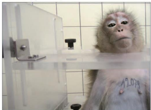
Zur Bewegungslosigkeit verdammt. Affe im „Primatenstuhl“