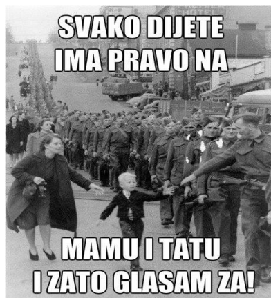
Abbildung 3: Jedes Kind hat das Recht auf Mutti und Vati. Deswegen bin ich „dafür“