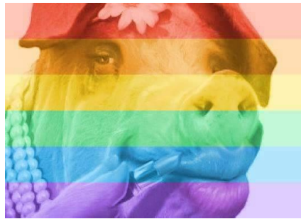
Abbildung 2: Gleichsetzung der Homosexuellen und Schweine