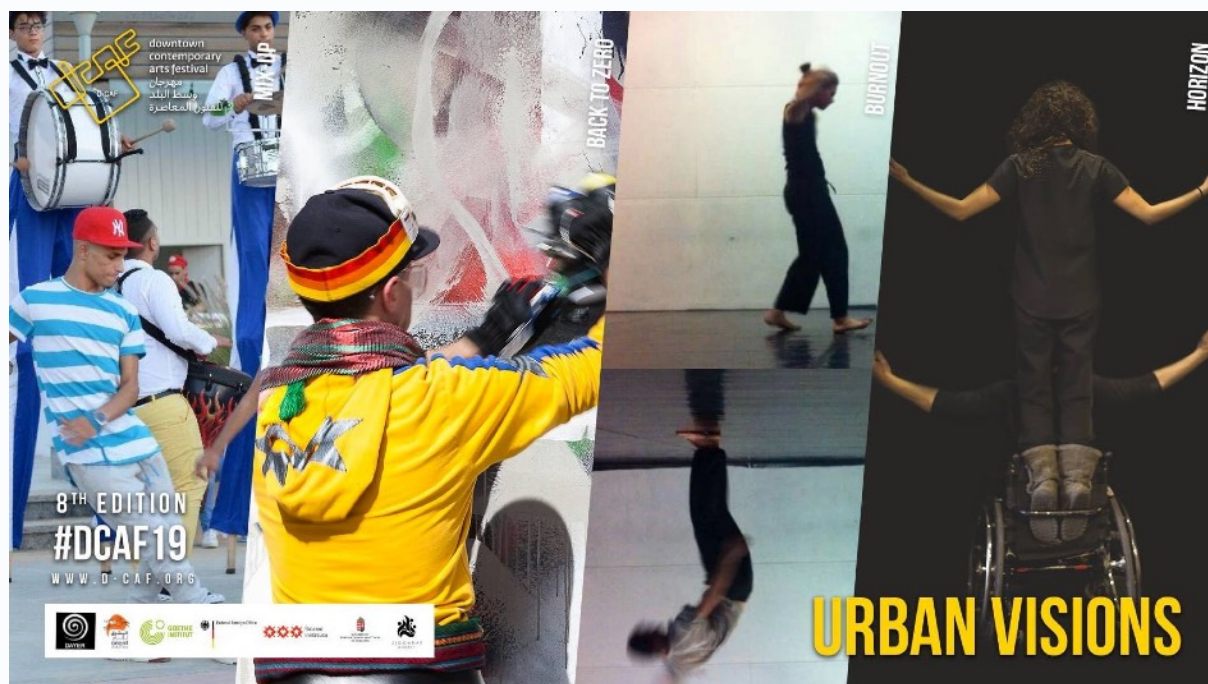
Figure 2 : « Urban Visions » dans le cadre du festival D-Caf, des performances de rue ?

La gestion sécuritaire ne porte pas uniquement sur des rassemblements mais aussi sur des pratiques artistiques individualisées. Dans ce cas, c'est la présence des forces de l'ordre dans les rues qui restreint ces pratiques. Pour un des graffeurs interrogés, ces contraintes portent non seulement sur la possibilité de réaliser de nouveaux graffitis – en 2015, il a été contrôlé et questionné par la police alors qu'il réalisait un graffiti – mais aussi sur la possibilité de les modifier ou même de les effacer. En contexte de répression et de perte des libertés politiques, il se sent dépossédé de son droit de regard sur ses œuvres. En effet, un de ses graffitis, réalisé en 2013, fait partie du pan de mur de l'Université américaine au Caire qui a été conservé dans la rue Mohamed Mahmoud (fig. 2). Cet artiste souhaiterait effacer son graffiti pour signifier que le « mouvement » auquel il a participé pendant la révolution est révolu :