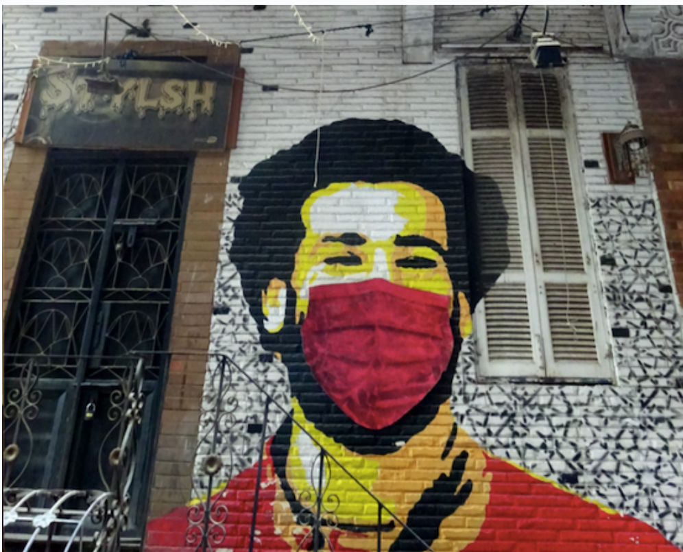
Figure 4b : Les portraits du café Bustan : du street art négocié entre artiste, propriétaire du café et autorités. Photographie de l'autrice, 2021.