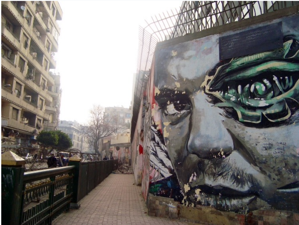
Figure 1a : Portrait d'un révolutionnaire s'étant fait tirer dans l'œil par la police à l'angle de la rue Mohamed Mahmoud et de la place Tahrir. On peut voir à gauche les barbelés mis en place par la police pour sécuriser la place Tahrir.