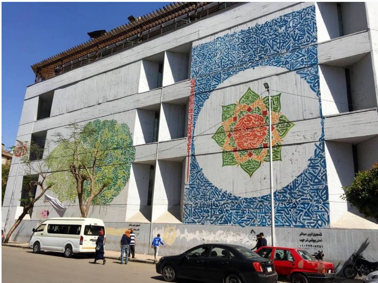
Figure 5 : Les fresques sur la façade du Greek Club reprenant les codes du graffiti : un art commissionné. Photographie de l'autrice, 2019.

Être présent dans le centre-ville en négociant ses pratiques ou en faisant avec les contraintes s'apparente ainsi à une revendication d'un droit à la centralité (Pappalardo), une centralité qui ne serait pas dictée uniquement par un accaparement sécuritaire et qui reposerait également sur une centralité artistique et culturelle.