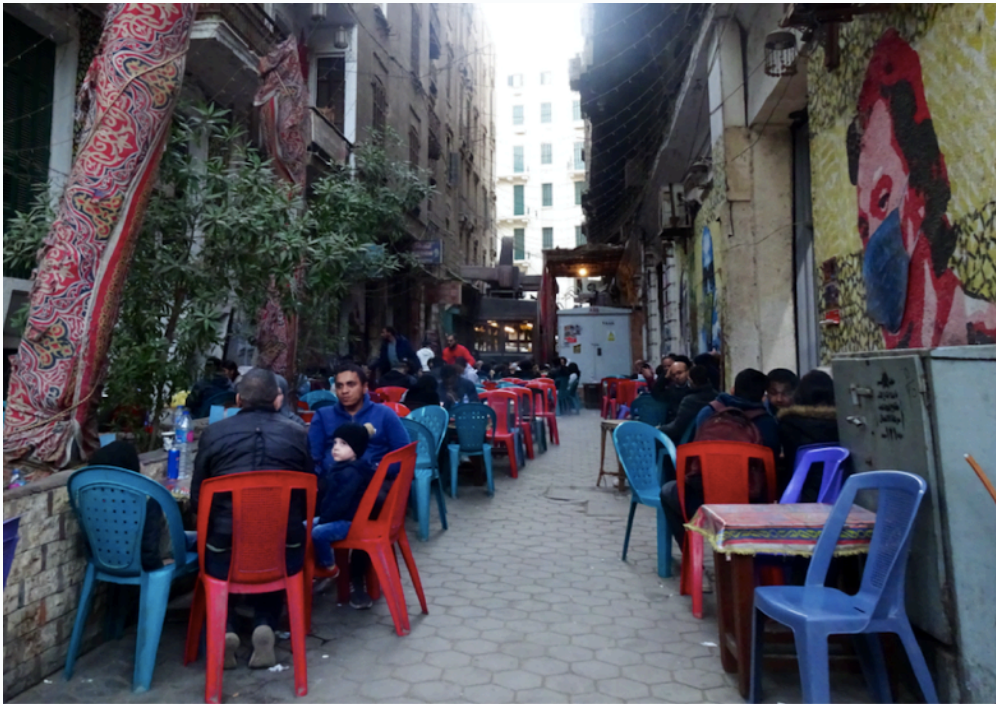
Figure 4a : Les portraits du café Bustan : du street art négocié entre artiste, propriétaire du café et autorités. Photographie de l'autrice, 2021.