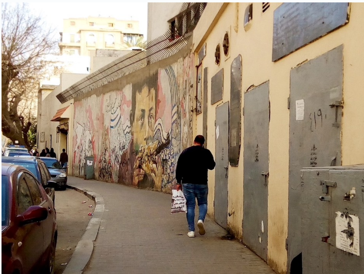
Figure 3 : La partie de la fresque murale de la rue Mohamed Mahmoud conservée jusqu'à aujourd'hui. Est encore visible l'œuvre d'un des graffeurs interrogés.

Plusieurs photographes mentionnent également les difficultés à prendre des photographies dans le centre-ville. L'importance de ces difficultés dépend de la densité des forces de l'ordre et des dispositifs sécuritaires tels que les murs, checkpoints, barbelés : il est interdit de prendre des photographies des acteurs de la sécurité et des dispositifs sécuritaires. Les contraintes sécuritaires dépendent également du sujet photographié : il est plus facile de se prendre en photographie ou de prendre des proches, que de tourner l'appareil vers les éléments de la ville :