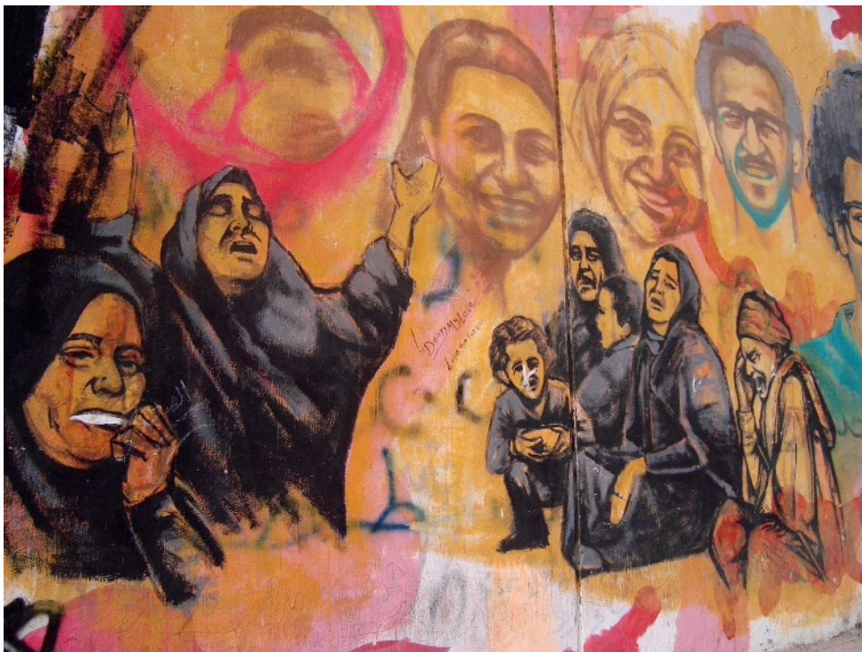
Figure 1b : Portraits des familles de martyrs. Le camouflage rose qui en constitue le fond est une manière de dénoncer l'armée qui cherche à « romantiser son rôle » dans la révolution, d'après l'un des artistes interrogés en 2015 qui a participé à ces fresques murales.