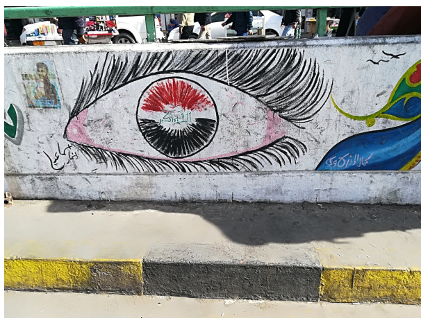
Planche 15 : La tradition esthétique du regard pénétrant aux sourcils fournis et arqués, attribué aux imams (en haut à gauche. Hussein, Bagdad, mars 2010) est réutilisée de manière récurrente. Elle se double en 2019 d'une fibre nationaliste : l'Irak devient littéralement « la prunelle des yeux » des manifestants. Mais c'est aussi un regard qui fixe le passant comme pour exprimer que rien ne lui échappe.