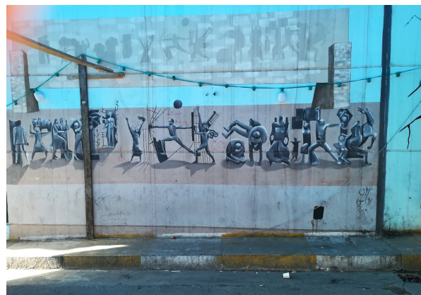
Planche 7 : La ville en abyme (1). Le Nasb al-Hurriyya et son motif central dans quelques configurations choisies parmi les centaines peintes en 2019. La frise est dédoublée en bas à droite, comme si les manifestants eux-mêmes s'étaient emparés du monument officiel, en haut, pour le démonter et le déposer au même niveau que la « rue citoyenne ». Images libres de droit, photographiées par Caecilia Pieri.