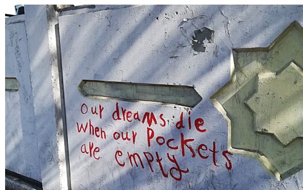
Planche 6 : Slogans politiques. Un jeu subtil entre les deux langues suggère un va-et-vient entre plusieurs audiences visées, du plus local au plus global : irakiennes/arabophones du monde entier/public occidental ou anglophone.

En haut : « Nous contemplons l'avenir sous des angles étroits ». Au milieu, à gauche : « Je veux mon pétrole ».