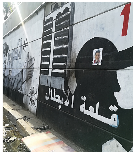
Planche 8 : La ville en abyme (2). Le Mat'am turki (en haut, à gauche) est littéralement « mis en scène » en fond de décor sur lequel se lève un rideau dévoilant une allégorie de l'innocence (petite fille), de l'espoir (fleurs), motif repris d'une fresque de Banksy en Palestine (le rideau et la police) ; assimilé aux grandes figures mésopotamiennes des lamassou (taureaux ailés) de Nemrod, glorifié en « château des héros » (en bas, à droite). Mêlant appel à l'unité nationale (récurrence du drapeau) et allusion au martyr (banderole avec les portraits des morts), cette nouvelle iconographie populaire convoque pathos et fierté dans un même élan dont le graphisme presque naïf valorise la lisibilité pour tous, loin des codes sophistiqués ou mondialisés du street art. Images libres de droit, photographiées par Caecilia Pieri.