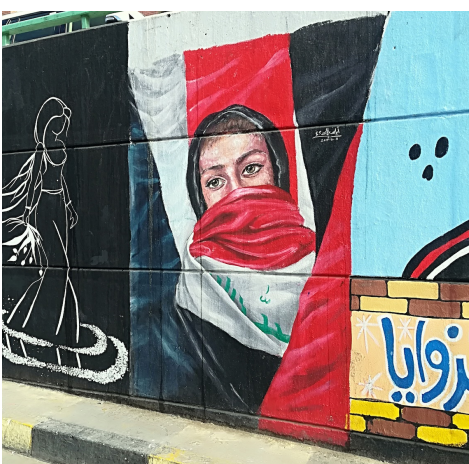
Planche 11 : Un nouvel héroïsme populaire (3). Les femmes rendues visibles, actrices incontournables de la révolution, dans la diversité idéale d'une société où elles trouveraient leur place, toutes catégories confondues, mères de famille, diplômées, professionnelles, associées au drapeau ou en égérie nationale juchée sur le tuk-tuk sauveur.