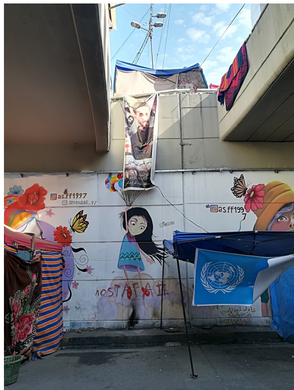
Planche 4 : Mondialisation des références et des styles, mais aussi lien établi entre les opprimés et leurs révoltes : de la révolution soviétique d'octobre 1917 – avec le « hashtag Octobre » en arabe – à la citation de l'artiste britannique Banksy – dont la petite fille au ballon a été créée sur le mur de séparation israélien à Bethléem en Palestine. Images libres de droit, photographiées par Caecilia Pieri.