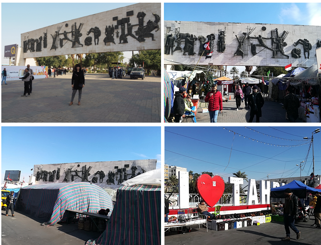
Planche 2 : Le Nasb al-Hurriyya, place Tahrir à Bagdad, devenu lieu d'échanges en tous genres, telle une kermesse populaire et citoyenne. En haut à gauche, la photo de l'esplanade dégagée date de janvier 2018.