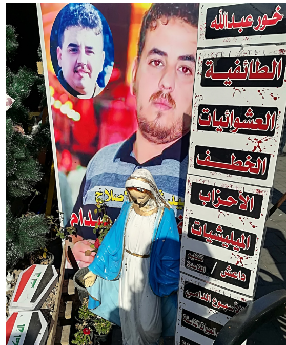
Planche 14 : L'affichage – peut-être tactique – d'une volonté d'union chiites-chrétiens utilise en abondance les figures de Marie et de Jésus, également révérees par les deux communautés. Il souligne en tout cas une unité bienvenue dans la lutte contre les maux dont la liste est affichée sur la banderole à droite : confessionnalisme, rapt, partis, Daesh, semaine sanglante, colis piégés, etc. Deux affiches à l'effigie de Jésus implorant sa miséricorde et sa protection contre le mal, le mensonge et la corruption : elles sont toutes deux explicitement signées : « Vos frères chrétiens ».