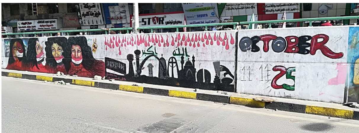
Planche 16 : Un nouveau pacte civique ? (1). L'Arche de la Victoire, icône belliqueuse entre toutes sous Saddam Hussein, est désormais intégrée au panthéon des symboles de fierté nationale par un groupe mixte de peintres dont certains noms sont chiites, or l'inscription appelle à la « paix sur Bagdad » (en haut). À cette même Arche de la Victoire, l'image du bas associe notamment une mosquée, la tour de Samarra, le sanctuaire sabéen de Bagdad et l'église catholique syriaque Notre-Dame de l'Intercession de Bagdad, victime d'un attentat meurtrier à Noël 2010. Au prix du sang ou dans l'idéalisation d'un paysage idyllique, chaque image manifeste la revendication de l'unité nationale.