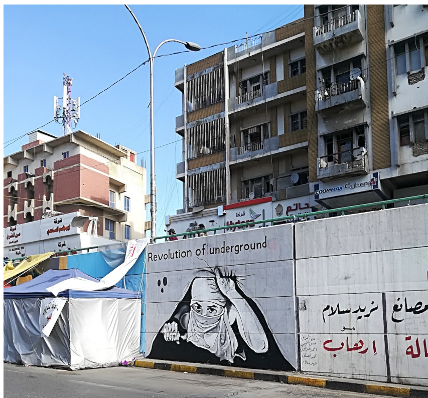
Planche 10 : Un nouvel héroïsme populaire (2). Les femmes rendues visibles et réunies par une même revendication au-delà des codes vestimentaires et linguistiques. Ci-dessus, le prototype de la femme occidentale, mais des graffitis en arabe : « La révolution ne tombera pas ; vous n'arrêterez pas notre révolution ». À droite, le prototype de la femme irakienne traditionnelle, mais un graffiti militant en anglais. Images libres de droit, photographées par Caecilia Pieri.