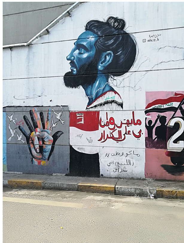
Planche 13 : Le sang du martyr(e), un élément rituel essentiel de la mystique chiite. Le drapeau dégouttant de sang est une manière imagée d'accuser la répression de porter la responsabilité d'un crime contre l'unité nationale. En haut à gauche : « Mur photographique. Made in Irak ». Au milieu, à gauche : « Je saigne mais je ne m'incline pas, parce que je ressemble à mon pays ». Images libres de droit, photographiées par Caecilia Pieri.