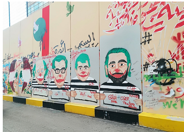
Planche 1 : La thawra au Caire (photos 2012, haut) et à Beyrouth (photos 2020, bas). Des caricatures ad hominem et une sophistication académique qu'on retrouve rarement dans les fresques de Bagdad en 2019. Images libres de droit, photographiées par Caecilia Pieri.