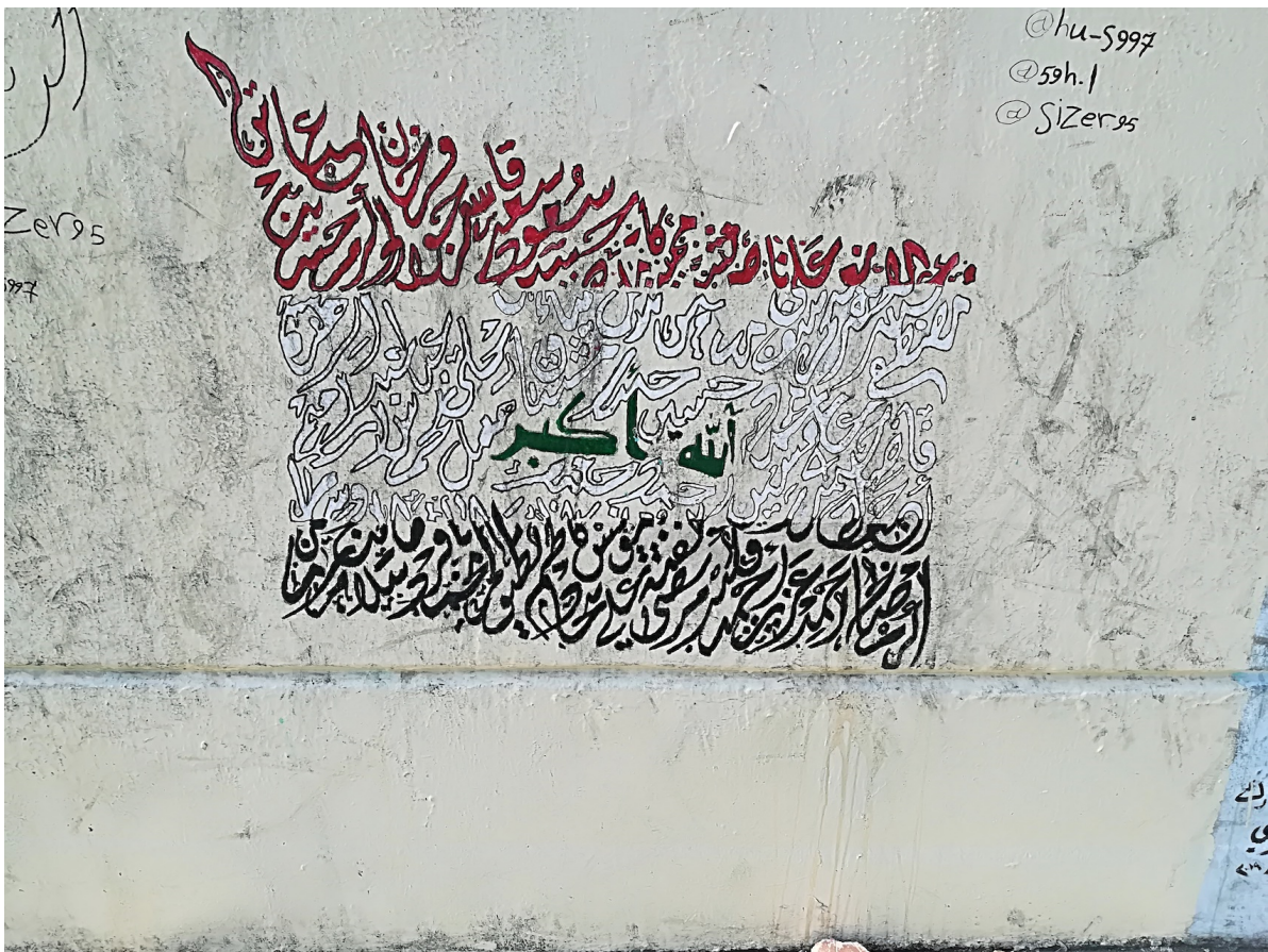
Planche 5 : Calligraphie. La fresque de droite, de l'artiste Sajjad originaire de Bassorah, mêle des citations du Coran et des noms de martyrs de la thawra . Images libres de droit, photographiées par Caecilia Pieri.