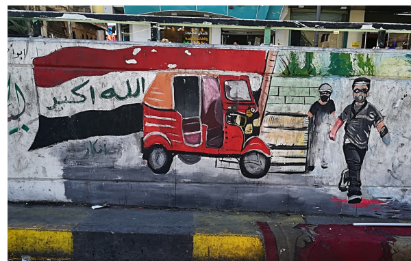
Planche 9 : Un nouvel héroïsme populaire national (1). Le tuk tuk en « sauveur tombé du ciel », les subalternes (vieux, handicapés), les invisibles (soignants, bénévoles anonymes, etc.).