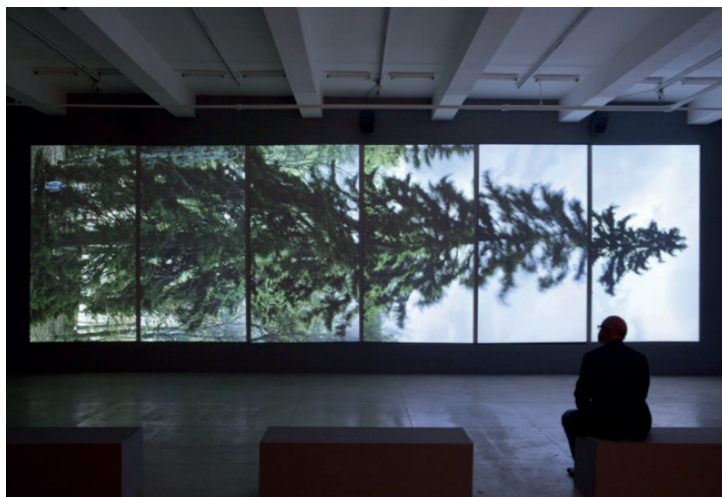
Eija-Liisa Ahtila, Horizontal , 2011.

ver las diferentes pantallas al mismo tiempo– con una lenta, por discontinua, línea narrativa. Ambas cosas dan tiempo para asimilar la complejidad de la nueva composición y uno se siente empujado a mirar de pantalla a pantalla, intentando vehementemente dar sentido a las combinaciones. Como resultado, las conexiones entre momentos históricos y preocupaciones actuales se hacen visibles y tangibles, de tal modo que el pasado colonial puede verse como presente en el presente, cuando tenemos la necesidad de distinguir entre culpa y responsabilidad 11 .