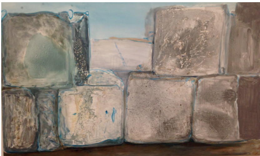
Marlene Dumas, Mindblocks . Pintura, 2009.

[...] obliges you to do theory but also furnishes you with the means of doing it. Thus, if you agree to accept it on theoretical terms, it will produce effects around itself [...] [and] forces us to ask ourselves what theory is. It is posed in theoretical terms; it produces theory; and it necessitates a reflection on theory (Bois et al. 1998).