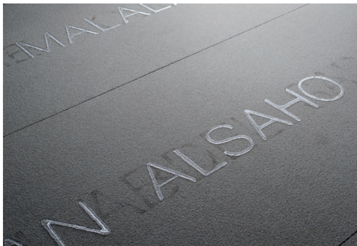
Doris Salcedo, Palimpsesto , 2017.

muertos retornando en el presente. Ese mostrar la continuidad hace su arte contemporáneo. Estoy pensando especialmente en la artista india Nalini Malani y sus famosos juegos de sombras, evocadas brevemente arriba. La sombra como rastro, así como los nombres escritos en arena en Palimpsesto , se convierte en un espectro cuando tenemos en cuenta el tiempo en sí mismo. Y el tiempo es el motor de la memoria, así como del olvido, del no-recuerdo y del mal-recuerdo. Cuando pensamos en el tiempo, no podemos ignorar la historia, pero estoy bajo el impacto de la contemporaneidad de esta obra de arte, por tanto, de la historia del presente. Ahí, la pluralidad de experiencias del tiempo llevan a lo que he denominado heterocronía 15 .