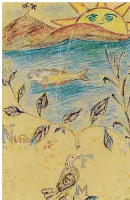
Fig. 1: Dibujo de Hernández sobre «El pez más viejo del río», enero de 1941.